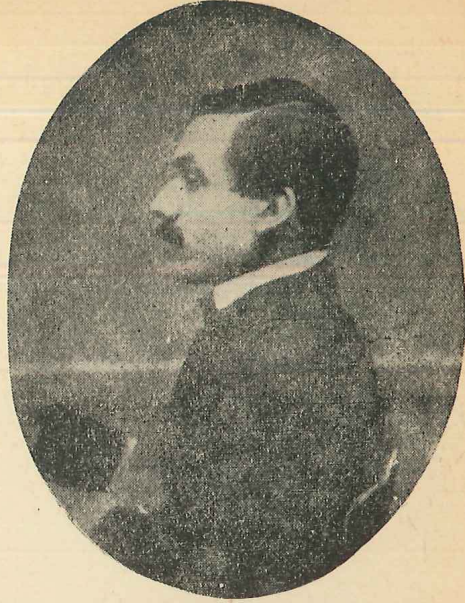
İbrahim Şinasi 1824-1871

Türk edebiyatına bugün içinde bulunduğu çağın yolunu açan edip ve şair Şinasi'nin ölümünün 100. yıldönümü dolayısıyla, bu büyük insanın son günlerini, hastalığını, ölümünü, gömülmesini anlatan ve bu konuda elde tek kaynak olan merhum Ebüzziya Tefvik'in bu yazısını aynen sunuyoruz.