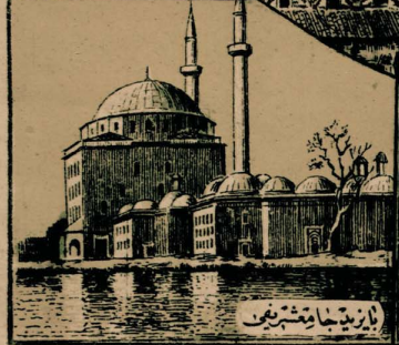
مسجد جامع مسجد

از روز جمعه ۹۹۲ هجری قمری سازندگان را در آنجا در آنجا ۱۰۰۰ هجری قمری . ۱۰۰۰ هجری قمری سازندگان را در آنجا در آنجا ۱۰۰۰ هجری قمری . ۱۰۰۰ هجری قمری سازندگان را در آنجا در آنجا ۱۰۰۰ هجری قمری . ۱۰۰۰ هجری قمری سازندگان را در آنجا در آنجا ۱۰۰۰ هجری قمری . ۱۰۰۰ هجری قمری سازندگان را در آنجا در آنجا