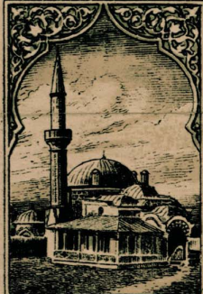
مسجد جامع مسجد

از روز جمعه ۹۹۲ هجری قمری سازندگان را در آنجا در آنجا ۱۰۰۰ هجری قمری . ۱۰۰۰ هجری قمری سازندگان را در آنجا در آنجا ۱۰۰۰ هجری قمری . ۱۰۰۰ هجری قمری سازندگان را در آنجا در آنجا ۱۰۰۰ هجری قمری . ۱۰۰۰ هجری قمری سازندگان را در آنجا در آنجا ۱۰۰۰ هجری قمری . ۱۰۰۰ هجری قمری سازندگان را در آنجا در آنجا ۱۰۰۰ هجری قمری . ۱۰۰۰ هجری قمری سازندگان را در آنجا در آنجا