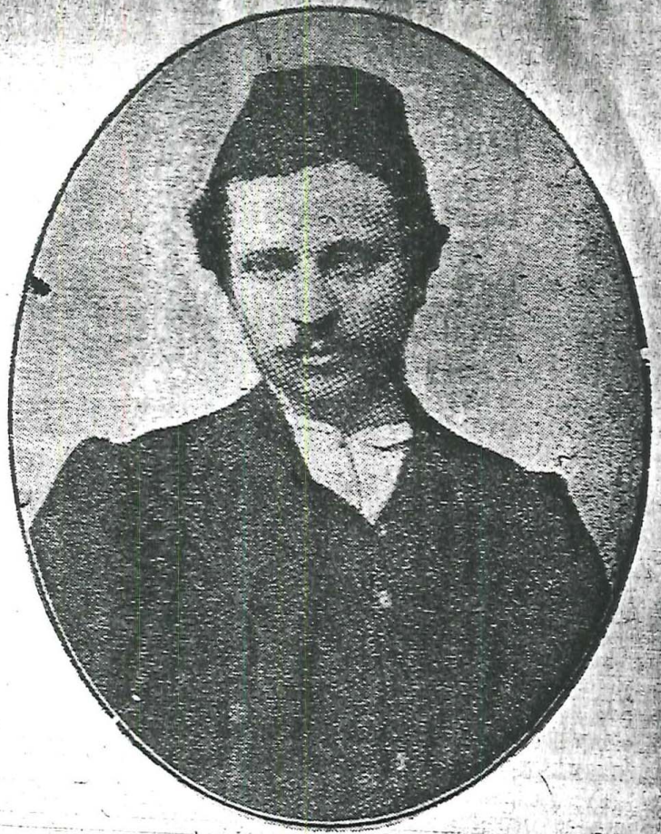
Namık Kemal... Yetişme çağlarında, ilk resimlerinden birisi.