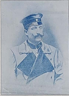
آلمانیا امپراطوری و پروسیا زالی حشمتلو اکیمی اوبایلیم حضرتلی S.M. Guillaume II empereur allemand, roi de Prusse