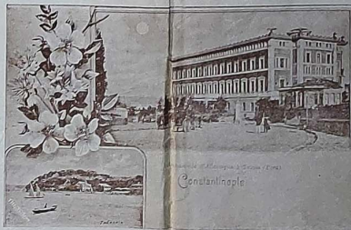
بک اوغلتده ایلمی باشاده و طریلده آلمانیا سفارتخانه لری L'ambassade d'Allemagne à Constantinople