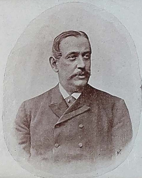
آلمانیا سفیری بارون مارشال حضرتلی S. E. le baron de Marschall, ambassadeur d'Allemagne