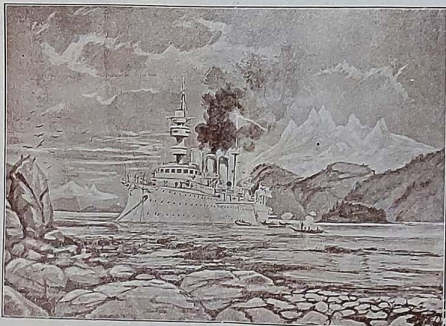
(هرتا) قروواتوری Le croiseur de 2e classe allemand "Hertha."