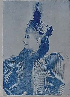
آلمانیا ایترویجه و پروسیا زالی حشمتلو اراغوستا و شوریا حضرتلی S. M. Augusta-Victoria, impératrice d'Allemagne