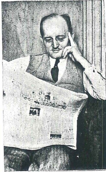
Kıymetli gazeteçnin ilk işi her sabah gazeteleri gözden geçirmektir.

— Fakat bu, herhalde ganimet bili-nen «ihtiyarî bir mecburiyet» olsa gerek üstat?