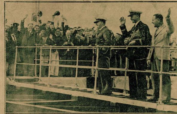
الطيار الإنكليزي السكايتن «ويلكسون» وخلفه مساعدته الميكانيكي بوبر عند وصولهما إلى مرنا فويتز بارلندا قيسل قيامهما برحلتها إلى أمريكا عبر المحيط الأطلنطي على متن الطائرة المائية «كاليدونيا» مفتحين الخط التجاري بين البلدين . والصورة تمثلهما وهما يردان تحية جماهير الشعب الإيرلندي التي وفدت لتسألهنهما