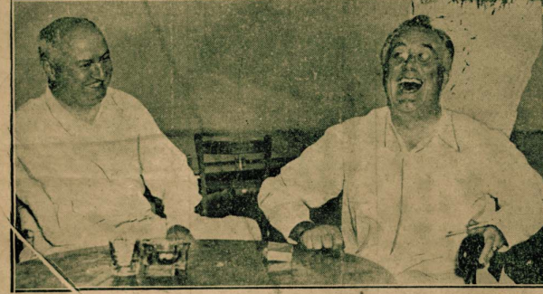
صورة ظرفسة للمستر روزفلت رئيس جمهورية الولايات المتحدة وقد أخذت له عند مروره أخيراً في مدينة «نابوليس» حيث نزل شيفاً على المستر «جيمس فارلي» للحصل بمصلحة الريديوري إلى اليمين وهو بضحك ملء شديقه لكتة قاد بها مضيقه الجانيتر بجانبه