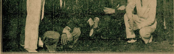
منظر لأندية العشاء التي أقامها التقاعد الرياضيون أمس تكريماً لجنم لندوس بعقل العالم في المسابقة بمناسبة زيارته لمسرح ويري المحفل به في الصورة مشيراً إليه بعلامة بـ وحوله ليفيف من المدهورين