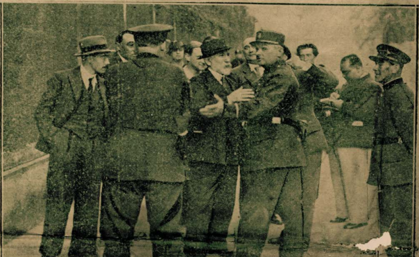
منظر لنادية المشاه التي اقامها النقشاد الرياضيون امس تكريما لجم لندوس بطل العالم في المصارعة بمناسبة زيارته لمصر ويرى المختفل يهني الصورة مشيرا اليه بعلامة x وحوله لثيف من المدعوين