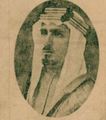
الدكتور محمد علي الشواف أحد أعيان الحكومة السعودية في الحجاز وهو من مجاهدي سوريا السابقين وقد وصل إلى القاهرة في طريقه إلى سوريا