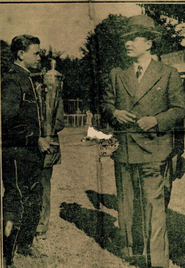
جلالة الملك وبجانبه الكاسي سلمها جلالاته للفائز

لا يخفى ان سلطة التولية والامر والتي كانت الى عهد الخديوي عباسي يد سلطان تركيا ، او المصري في يد الصمد الاعظم . فحكم مصر ، حتى ١٩١٤ ، لم يكونوا سوى تابعين لملوكه العلية مهما تختلف اقبامهم . وكانت معاهدة لندن التي سنة ١٨٤١ تعنى بان يتولى الحكم امير افراد الاسرة سناً ، لم تغير هذا النظام بعد محاولات الخديوي اسماعيل فاستقرت مرسوماً من الباب العالي باحقية الابن الابن في توريته الملك بعد وفاة ابيه . على الا يد واليا شرعياً الا اذا جاء مرسوم التولية من السلطان بحمله موظف كبير . وهالك كان يحتفل احتفالاً عظيماً بتتوالى رسوم في قلعة القاهرة بحضور امراء الاسرة والعلماء وكبار الموظفين ورؤساء الجيش والاجيان وتوطلق المافع وتوزع الصدقات من بيت والدة الحاكم الجديد وبعد قليل يذهب الوالي الجديد الى الاستانسة