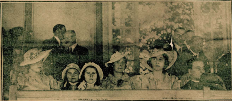
جلالة الملك يشاهد حفلة ألعاب الفروسية العسكرية التي أقيمت أخيراً في فيشي وسلم فيها جلالاته الجوائز للفائزين وهو يرى جالساً إلى أقصى اليمين وبجانبه صاحبات السور الملكي الأميرات شرفتهن : الأميرة فوزية فالانسة ذوالفقار فالأميرات فائقة وفتحية وفائزة وقد وقف إلى اليمين أحد حرسين باشا