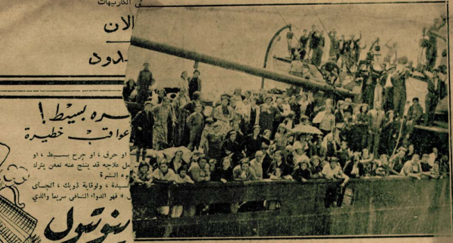
ان الانسان من رجال ونساء واطفال ويبلغ عددهم الفا وثمانماية وخمسين لاجلاً في البريطانية « ستانكوفت » عند مرورهم بعينها نانت بفرنسا قادمين من سانتاندر في ما