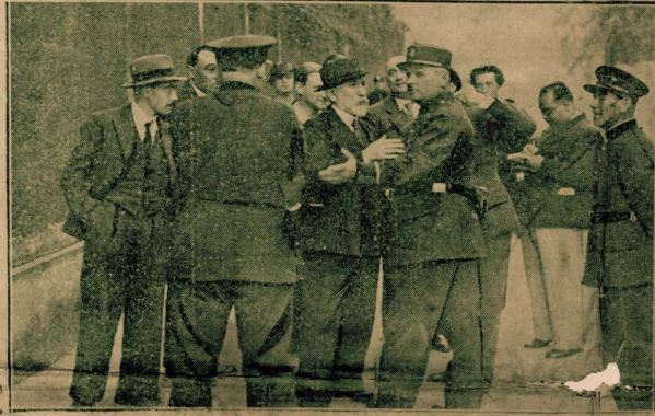
المسيو شارل موراس الكاتب الفرنسي المشهور عند اخلاسيه من سجن «الصححة» في باريس بعد ان قضى المدة المحكوم بها عليه وهي تسعة اشهر من أجل مقالة نشرها في جريدة «الأكسيون فرانسيز» ورات فيها حكومة المسيو بلوم في ذلك الوقت تحريضاً على القتل . والصورة تمثلت وهو يتحدث إلى أحد رجال البوليس وحوله بعض أنصاره