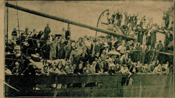
من الاسبان من رجال ونساء وانفال ويبلغ عددهم الفا وثمانماية وخمسين لاجساً ويرون على ظهر الباسخرة البريطانية «ستانكروفت» عند مرورهم بميناء نانت بفرنسا قادمين من سانتندر في طريقهم إلى الكتلترا