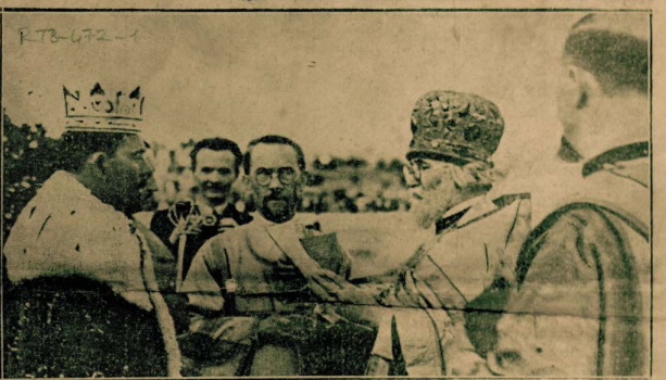
انتخب اخيرا في وارسوفيا بولنديا «جان كوك» مكا جديدا على الفجر واحتفل بتتويجه بحضور خمسة الاف شخص في معب الجيش البولندي . وترى في الصورة الحفلة الدينية التي اقيمت لتتويج الملك وقد ظهر الى اليمين رئيس اساقفة وارسوفيا الاوثوكسي وهو يتلو صلاة التتويج وامامه الملك