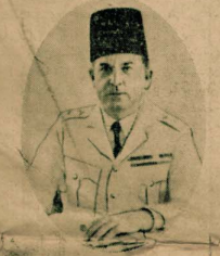
البيكاشي كرانك هرق مفتش قسم بوليس ميناء بورسعيد وقد رفق الى رتبة القائمقام وهو الذي سيتولى اعمال حاكمدار بوليس القتال في التناهي قياب البرالي جايترز بك بالاجارة