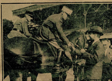
جلالة الملك وبجانبه الكاسي سلمها جلالاته للفائز