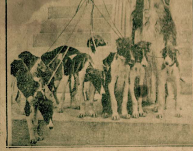
إلى اليمين : الأتسة «جيران-سوتران» التي فازت بالجائزة الأولى في مسابقة «المرأة وكلها» التي أقيمت في معرض باريس وترى قابضة على كلابها وهي من نوع «السولتي»