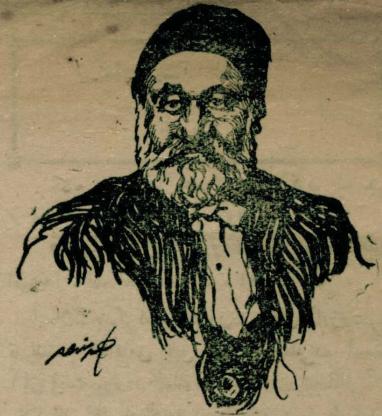
احمد وفق پاشا مرحوم

زه ، نورکاره باشلیجه ایی سبیدن بروجیبه در، بوراده اک اول زره اولوزی حسر ایتدیرن احمد وفق پاشا مرحومی حرمتله یاک ایدلم . زیرا احمد وفق پاشا مولیهرک اولاموت آرزوسنک نیت حقیقه لرلی بزده قدیر ایدنلرک ایلی اولمله اکتفا ایتیهرک قوه قلبه سنک بوون، موغدیله اولرلی - اصلنده کی قوف ضایع ایتهدن - لسانزه نقل ایله شدر، اولمز ضربک دیکر برچوق نا، اولرلی کی مولیهرک آمانسنک ده لسانزه مکس بولا، بجی اغلب ایتلدر . ایکنجی سبیل ایسه مولیهرک کندی احضار ایدر، لسانزه « کوپلی کیماری » عنوانیه ترجه ایدیلن ( Le Bourgeois gentilhomme ) ک اصلنده تورک ایتالی تسمیه اولان برشم واردر . بوئک ماهیتی تقدیر ایچون فرانسه ده اون دردنجی لوقی وزده سلطان سلیمان قانوی دوریه بر آزار جاع نظر ایتک لارم کایر، اون دردنجی لوئیک ، هر درلو نیریفکله فوقنده اولان زینت وسطاقتنه هولیهر نیسارو قوم پاتیا سی وارلرله آبری برقیمت بخش ایتدیکندن سرابده مستحق بره قونم اشغال ایتدی بریره لده ( ۱۷۶۰ سنه میلادی سی ) سلطان سلیمان قانوی ایلك سفیر