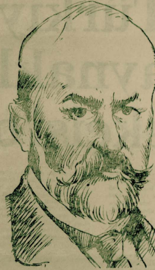
Ebüzzîya Tevfik'in bir portresi