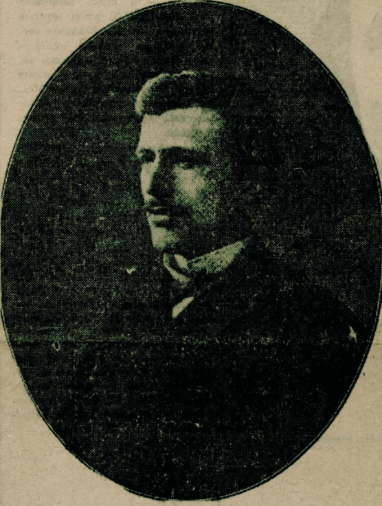
Ebüzziya, «Nümune-i Edebiyatı Osmaniye-yi yazdığı gençlik yıllarında

da vatan sairinin 15 mektubunu nesretmiştir. (Bu mektupların listesi aşağıdadır.)