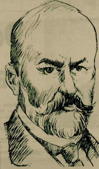
Ebüzziya Tevfik'in bir portresi

(İhtilal) gazetesinde de kapatılmıştır. Bu olaydan iki gün evvel ceza müddetini doldurup tekrar çıkmaya basılan (Hadika) ise, Tevfik beyin sürgüne gönderilmesiyle (Semsettin Sami) bey çıkarmaya başladı. 19.4.1873'de hükümet bu gazeteyi de kapattı. Namık Kemal Kıbrıs'a, Tevfik beyi Ahmet Mithat Efendi Rodos'a, Nuri ile İsmail Hakkı Bereketkâr'da Akkaya Kalesi'nde hibe yollandı. Rodos zindanında Tevfik bey yine mektuplarıyla yazıyor ve İstanbul'a yazıyarak yayım yaptırıyor. Bir mahkûmun imzası altında yayım yapması yasa dışı olduğu da Tevfik bey oğlu Ziya'nın adına nispete (Ziyannı habesi) mektep olan (Ebüzziya) imzası ile yazılarını yayımlıyordu. Ebüzziya, Rodos zindanında 1873 yılı Nisan ayından Abdülhamit'in tahlil edilip yerine Sultan Murat'ın geçiş tarihi olan 20. V.1878 tarihine kadar kaldı. 21.V. 1878'de İstanbul'a döndü. Bundan sonra Tevfik beyi, hapiste iken yazdığı yazılarının altına imzasını attığı (Ebüzziya) olarak anıcağız. Matbaa-i Ebüzziyası ile, Ebüzziya takvimleri ile artık o basın hayatını Tevfik beyi deşli Ebüzziya'sıdır. Rodos da İhtilal Ebüzziya boş durmadı. İstanbul'daki gazetelerine «Ebüzziya» isimli makaleler yerleştirmekte devam etti. Hapishanedeki mahkûmları din yaptıkları kaba saba işleri ele alarak, onlara bu işleri deşli istanca daha zahir ve çekici olarak yapma sollarını gösterdi. Kaba saba bu işlerden toplanan işler Ebüzziya'nun