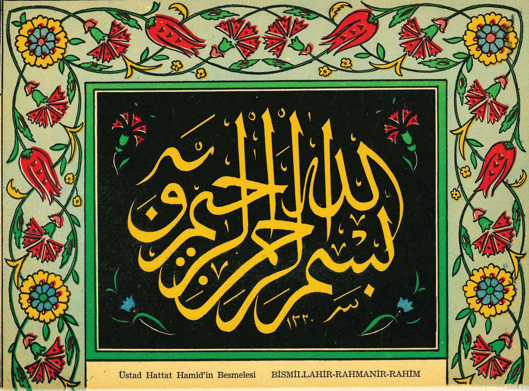
Üstad Hattat Hamid'in Besmelesi BİSMİLLAHİR-RAHMANİR-RAHİM