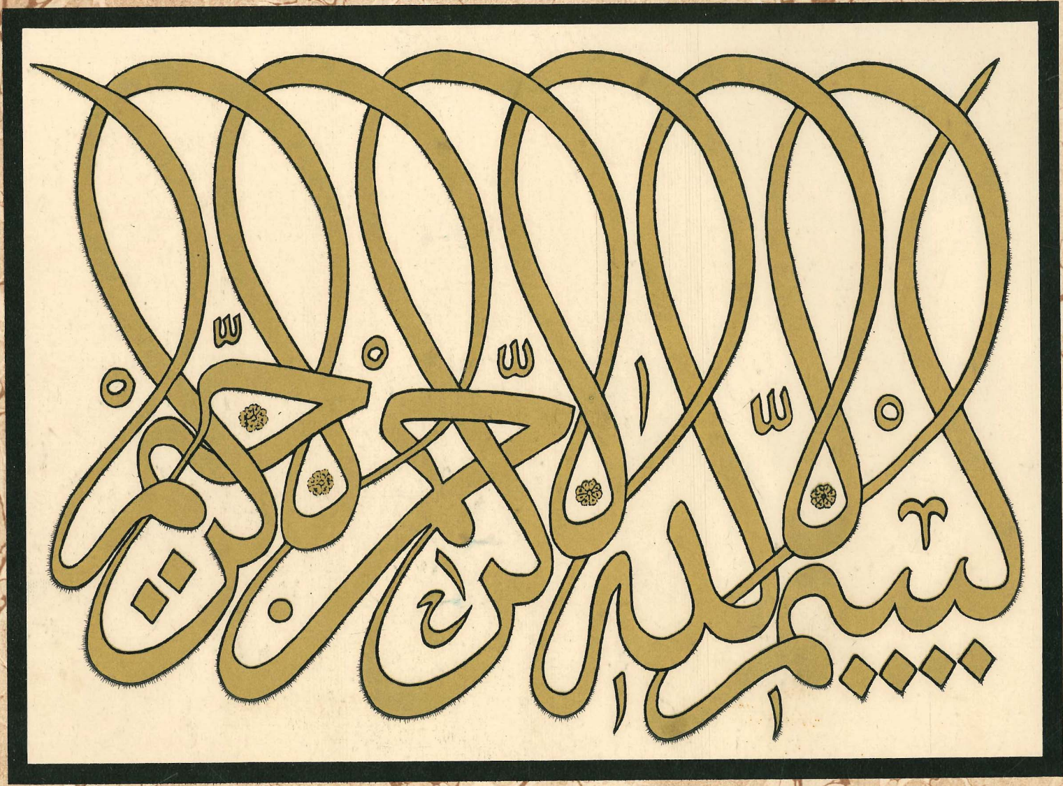
Büyük hattat Ahmet Karahisarî'nin Besmelesi