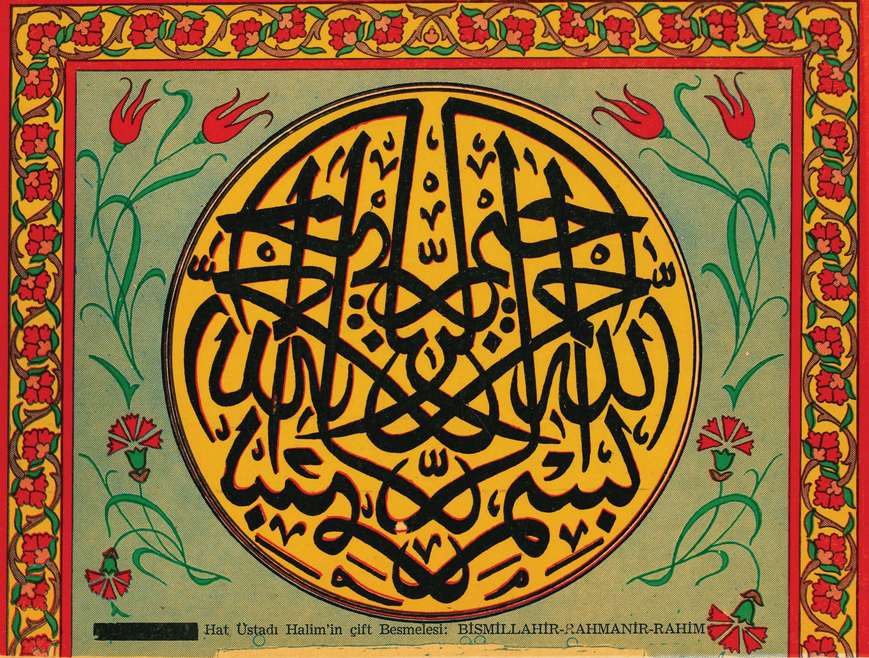
Hat Ustadı Halim'in çift Besmelesi: BİSMİLLAHİR-RAHMANİR-RAHİM