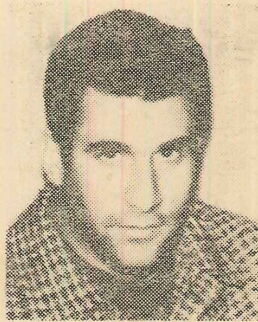
10 — Deniz Gezmiş