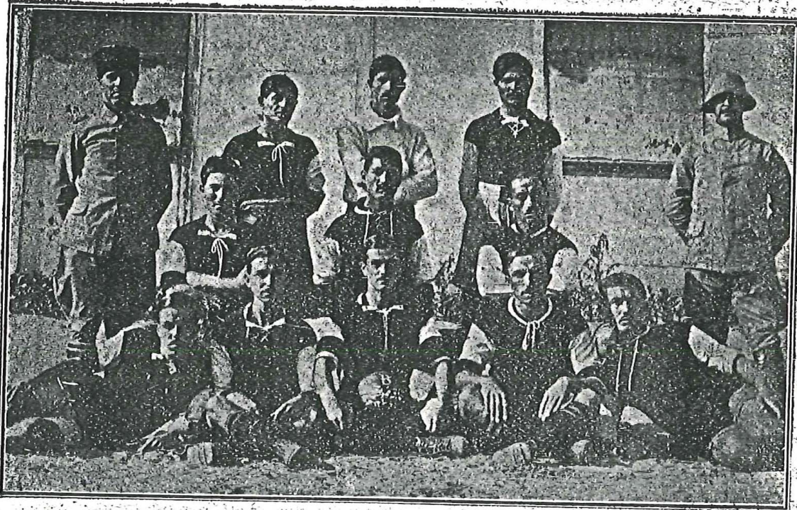
مصرده قوتلی تورک اسرا طاقی

بوگون محترم قارلریمزه عرض ایتدیکنم ز رسملردن بری اشیر اولان ، آیلردن وسنه لردنری قویسنا ، سیدبشیر ، طور اقرارگاهلرنده عمرلرینک مهم برقمسی اسارت آخیرله یکن ضابطان قارده شلرینک برطاقی در بونک کی برچوق طاقتلر ، قلوبلر تشکیلی ایله اسارتده فودبول وادمان ایچون چالیشامش . اوغراشیلیمش بوفسراق ایچنده بزوارلق کوسترلمشدر . اسارتده ، حقیقه فودبول ، آلتورقه ، آلتورانه کولیش ، منچ ، اسقریم ، اسوهچ اصولی