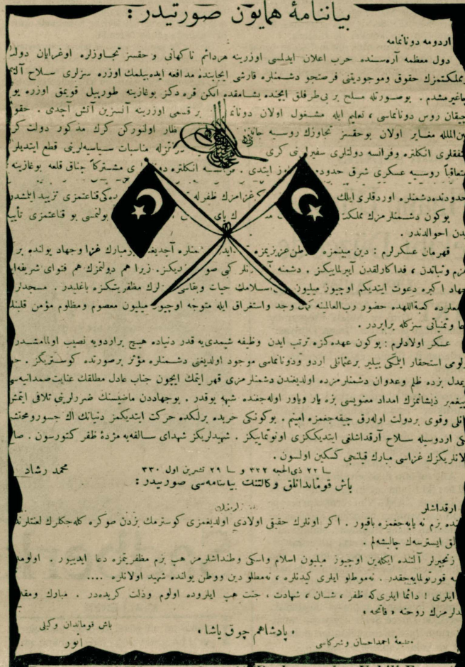
Beyanname-i Hümayun Sureti/Başkumandan Vekili Enver/Padişah Mehmet Reşad

Hesaplar baştan sona yanlıştı. Devletin gücünü de düşmanların güçlerini de yanlış değerlendirmişler, böylece bugünkü feci neticeye yaklaşmışlardı. Ve daha fenası, asıl fenası, devlet, birkaç kişinin sözü haline gelmiş; bunların kendi aralarında ihtilâfa düşmesi yetmiyormuş gibi, bir de topu birden Alman müttefiklerimizin avucuna düşmüşlerdi!