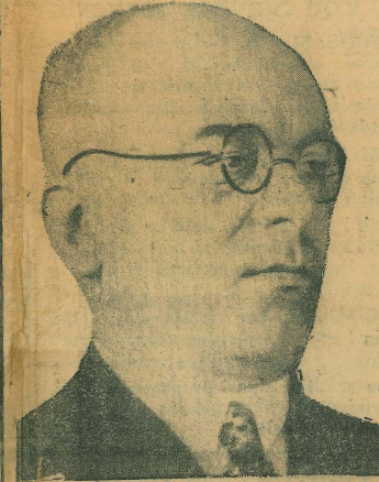
Deniz ve Hava müsteşarı Sadullah B.

Türk limanları arasında çalışan ve purların 1 Eylül'den itibaren mevkiî tabbika konulacak yeni seyrüsefer ve ücret tarifelerini tanzim edecek komisyon, bugün öğleden sonra ilk içtimalı deniz ticaret müdürlüğü salonunda aktecektir.