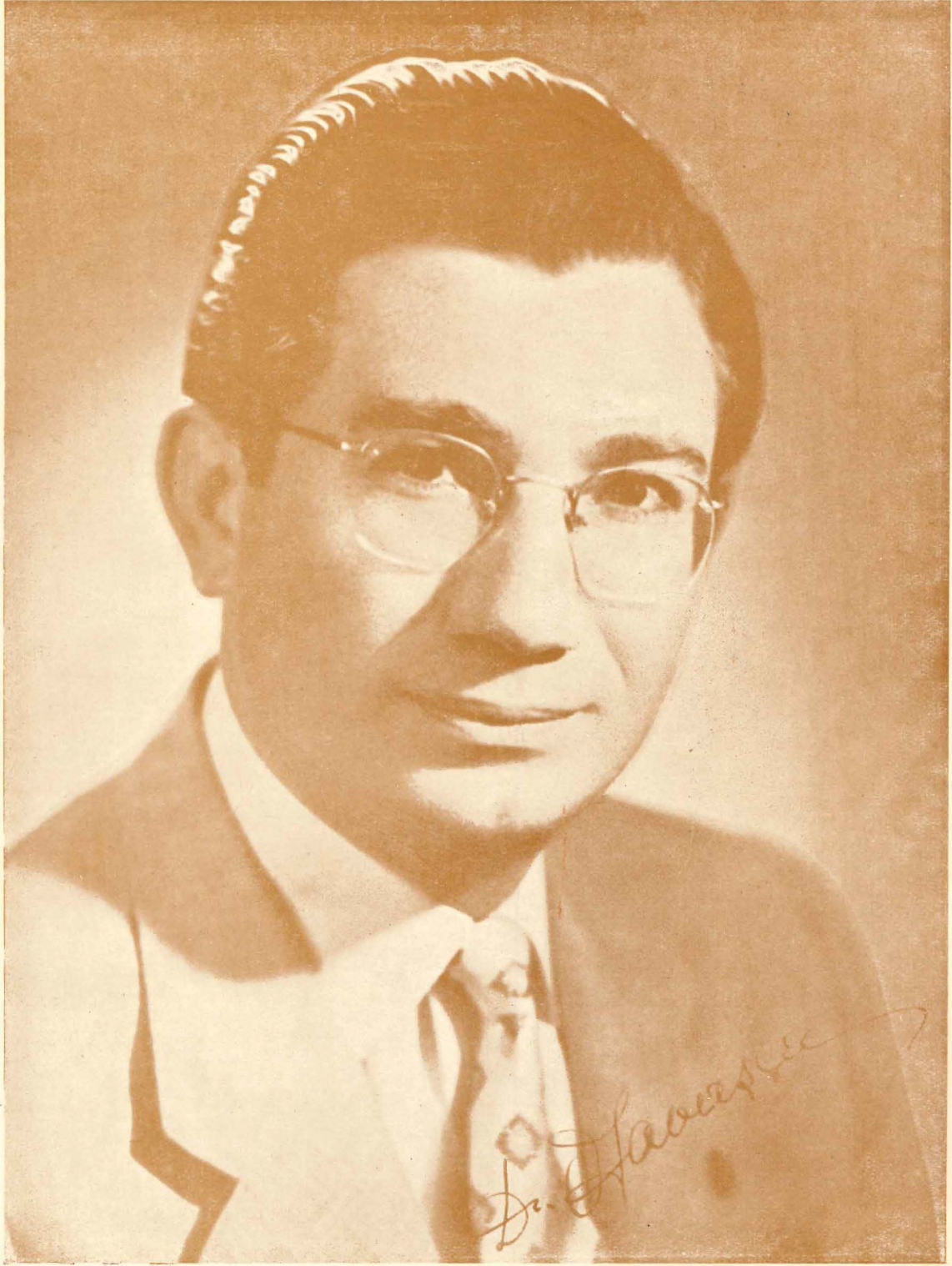
Dr. ALÂEDDİN YAVAŞÇA