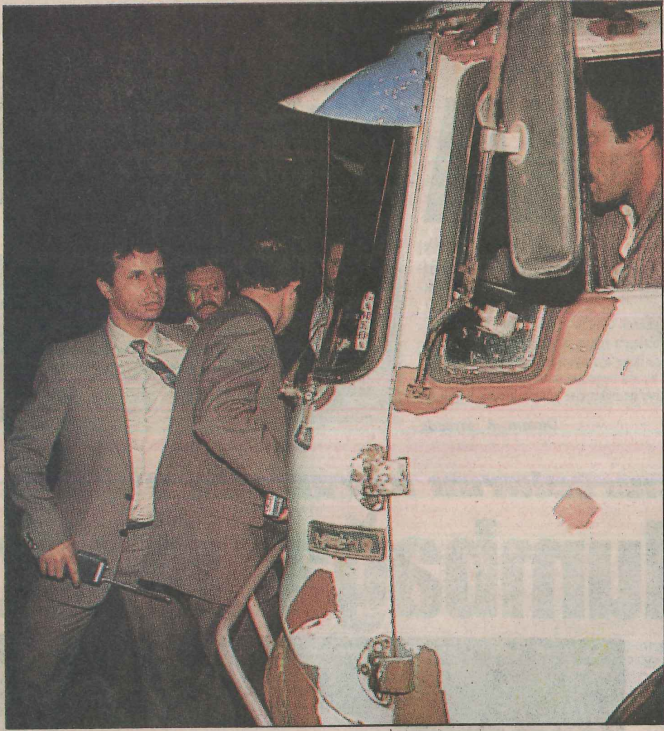
ÖNÜNÜ KESTİLER DGM Savcısı'nın sözlü emri üzerine harekete geçen sivil polisler saat 20.30'da Ankara matbaamıza gelerek dağıtım kamyonumuzun önünü keserek şoförü aşağı indirdiler. Görevliler İç Anadolu'ya ve Karadeniz bölgelerine sevkedilmek üzere paketlenmiş gazeteleri kamyonlardan indirdiler.